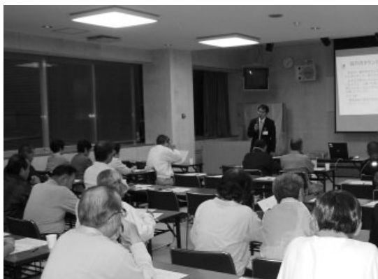
タウンミーティングには多くの市民が参加

今後は、これら市民の皆さんの意見を参考にしながら、今年度末までに総合計画基本構想および基本計画の素案を策定します。