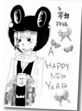
▷ P.N 雅羅