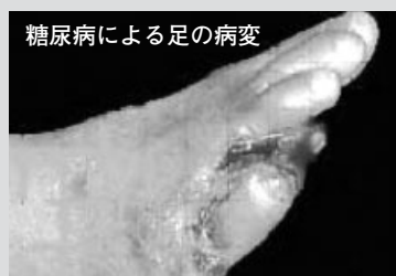
糖尿病による足の病変

皆さん、自分の足や家族の足を見ていますか? 足は、脳や心臓から最も遠いので、血管や神経の病気が早く現れる場所なのですが、寒くなると意外に見えていないものです。動脈硬化や糖尿病の人は、足にいろいろな症状が出ているのですが、気に留めていないことが多く、足の皮膚の病気や軽いけがをきっかけに傷ができ、化膿して直らなくなります。特に、糖尿病や背骨の病気で足の感覚が鈍くなっている時には、傷がひどくなつてからやっと気付くことが多いようです。そうになると、治療が難しくなります。冬は足の血行が悪くなり、足が荒れる時期です。足を見て、きれいに洗って、トラブルの発生を防止しましょう。