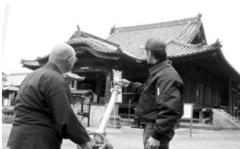
自主防火訓練に励む市民の皆さん

国民の貴重な文化財を後世に引き継ぐために、「文化財防火デー」を機会に文化財の関係者はもとより、周辺地域住民との連携・協力体制を密にすることが必要です。