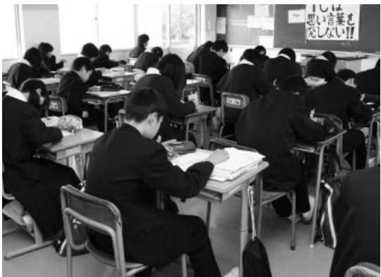
学力向上に向けて、さまざまな取り組みを開始

なお、小学校の無回答率については依然として高い傾向にありますが、中学校においては減ってきています。今回の調査で明らかになった本市の課題は、学習習慣の確かな定着や言語活動にかかわる表現力の向上です。そのためには、習熟度別の指導の充実・指導方法を工夫したり、放課後や長期休業中の学習指導の機会を増やしたりするこ