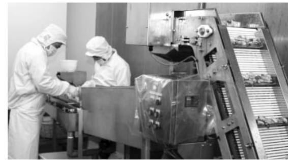
海水の電気分解による滅菌、計量から袋詰めまでの自動化など徹底した衛生管理を行う邑久町漁協出荷場

■問い合わせ先 邑久町漁協直売所 ☎0869-25-1010 (定休日 火曜日) ホームページ(レシピあり) http://www.jfoku.or.jp/