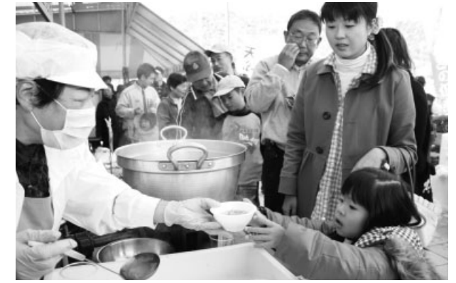
「わたしにもちょうだい！」大粒のカキが入った味噌汁に長い行列

11月23日、道の駅黒井山グリーンパーク内の邑久町漁協直売所で「カキの日」のイベントが行われました。この日は「勤労感謝の日に栄養豊富なカキで活力を」と全国漁業協同組合連合会が定めたものです。岡山県産カキの水揚げ量は、全国第3位。本市は、その約半分を占める全国的に有名な産地です。当日は、虫明産のカキが格安で販売されるとあって、朝早くから大にぎわい。また、焼きカキ、味噌汁の試食には、長い行列ができていました。食べ方はいろいろ。詳しいレシピは同漁協のHPで。皆さんもこの冬の味覚をぜひご賞味ください。