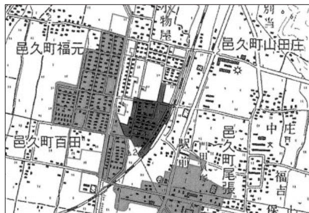
今回供用開始区域