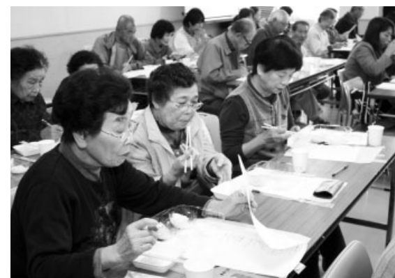
もぐもぐ…真剣な表情で評価

11月13日、(財)瀬戸内市振興公社が中央公民館でお米の食味会を開催しました。消費者や販売業者、行政関係者などの参加者が、市内で収穫した5品種の味、食感、香りなどを食べ比べました。試食したお米には、胚芽が普通の白米より大きく、肝機能改善などさまざまな効果があるとされるギャバを多く含んだ「胚芽プレミアム」、粘りの強い低アミロース米「中国192号」など、新しい形質をもつ米(新形質米)などもあり、評価結果は、今後の試験研究などに生かされることになっています。