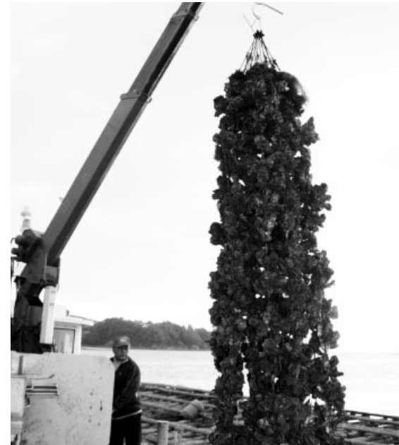
朝焼けの中で行われたカキの初水揚げ