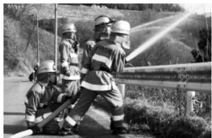
消防本部、消防団などが一体となって訓練

春は、林野火災が多発する時期です。昨年は、市内で7件の発生がありました。空気が乾燥し、季節風が吹くなど林野火災が発生しやすい気象条件に加え、枯草焼きや、山菜採りなどの入山者の増加が原因と考えられます。一度発生すると大きな被害をもたらす林野火災。未然に防ぐために、風の強い日や乾燥している日は火気の使用は控えて、もし、使