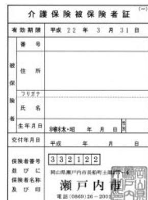
有効期限の入った被保険者証も今までどおり使えます