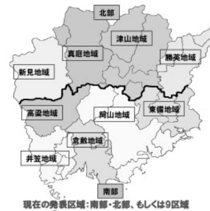
現在の発表区域：南部・北部、もしくは9区域