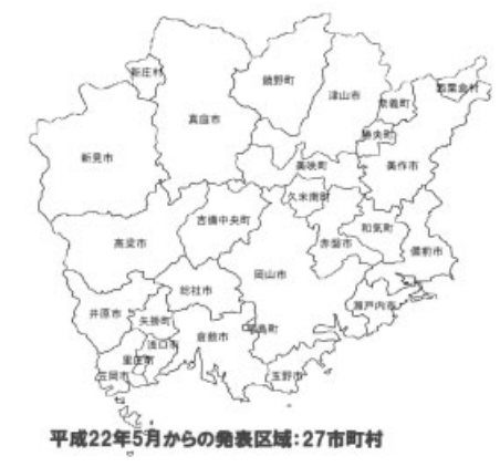
平成22年5月からの発表区域：27市町村

災害情報などをメール配信する本市の「瀬戸内市メールマガジン」に登録するなど、これらのシステムを有効に活用し、気象情報には日ごろから関心を持ち、災害時に適切な行動がとれるよう心掛けてください。