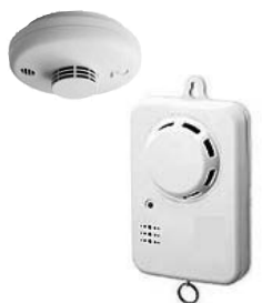
さまざまな形状の警報器

消防法により、全ての住宅に、住宅用火災警報器の設置が義務付けられています。平成16年以前に建築された既存住宅でも、平成23年5月31日までに設置が必要ですが、義務化されたのは、寝室および2階に寝室がある場合の階段室で、居室や台所にも設置すればより効果的です。平成20年中、全国では住