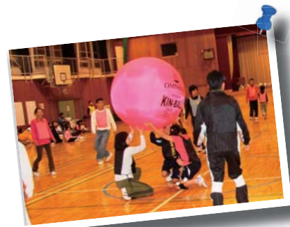
みんなで楽しんだキンボール

11月13日、牛窓体育館で、地区対抗キンボール大会を開催しました。牛窓地域地区体育推進委員会、瀬戸内市体育協会が主催するこのキンボール大会も、今回で6回目となります。