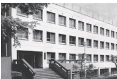
東京寮から新生活をスタートしてみませんか