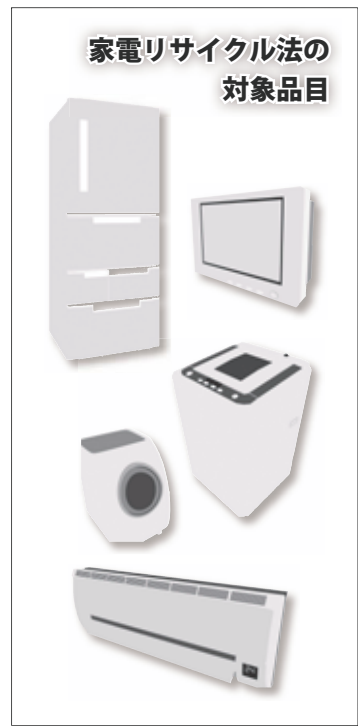
これらの家電は、製造業者などによる適正なリサイクルが義務付けられています

とがあります。特に、テレビ（ブラウン管、液晶、プラズマ）、エアコン（室外機を含む）、洗濯機（乾燥機を含む）、冷蔵・冷凍庫の家電リサイクル法の対象品目については、製造業者などによるリサイクルが義務付けられています。