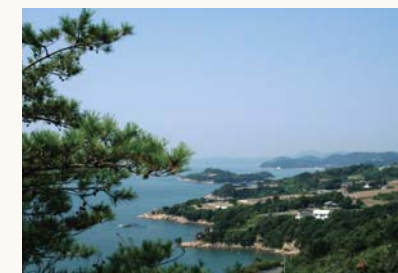
瀬戸内海の多島美を楽しむことができる前島