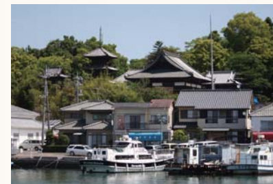
牛窓のまちを見守ってきた本蓮寺

牛窓、前島を歩いてみませんか 健やか 爽やか ウォーク日本 1800 瀬戸内市大会