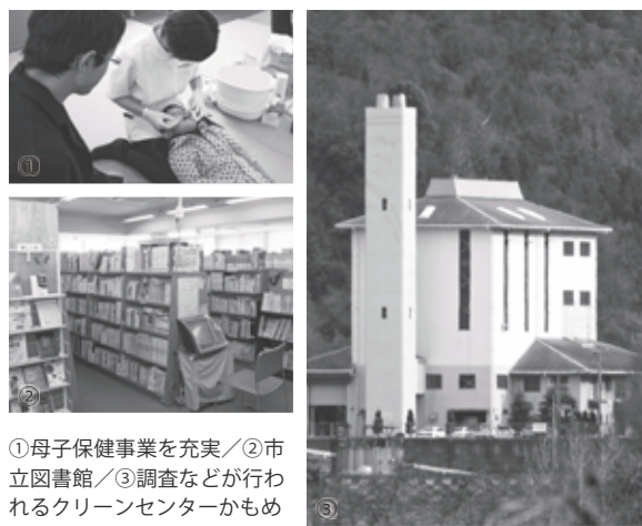
①母子保健事業を充実／②市立図書館／③調査などが行われるクリーンセンターかもめ

牛窓処理区では長浜地内、邑久処理区では福元・下笠加地内、長船中央処理区では土師・服部地内の管渠工事を進めます。