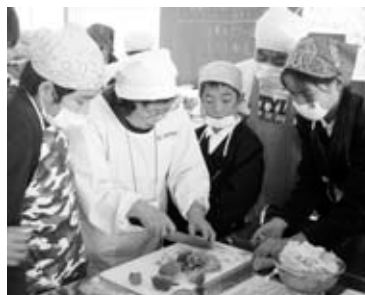
小学校で郷土料理の調理指導

市では、市民の皆さんが食事を通じて健康的な生活を送ることができるよう、さまざまな取り組みを行っています。