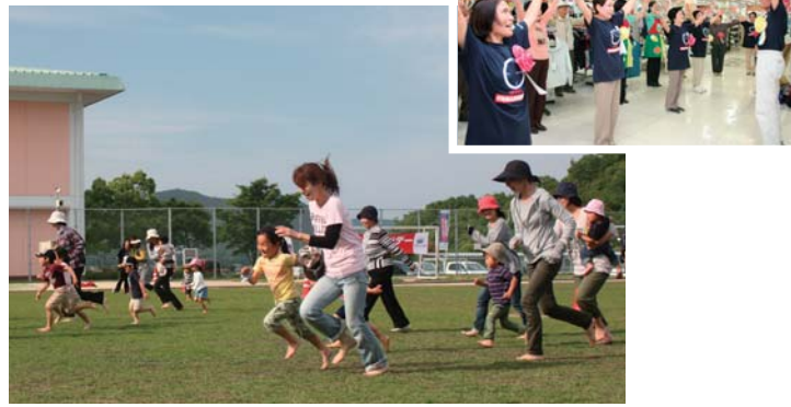
芝生の上をはだして走る親子連れ（左下）／健康体操で毎日はずつつ（右上）

参加人数は16,967人で、参加率は目標としていた40%を上回り43.2%となりました。