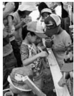
清涼感を覚めるそうめん流し

8月は、夏を存分に味わえる「そうめん流し」と「四季薫る紙粘土遊び・地元野菜を使ったムース作り」を行います。