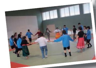
邑久高校生と一緒に踊る邑友タイム

(ゆうゆう) タイム」に参加し、市民講座の講師として、フォークダンスの楽しさを伝えていきます。