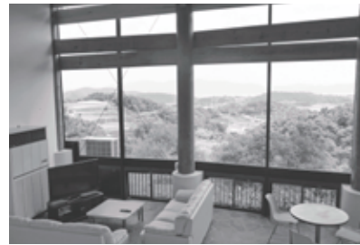
ヴィラのロビーから望む瀬戸内の多島美

牛窓国際交流ヴィラ（牛窓町牛窓）は、外国人向けの宿泊施設として岡山県が運営していましたが、平成21年4月に閉鎖されました。その後、施設改修が行われ、平成23年3月に市に無償譲渡されました。 市では、その名称を瀬戸内市牛窓国際交流ヴィラとし、利用者を外国人に限定しないこととした上で、7月1日からリニューアル