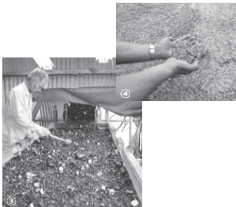
③粉碎されたビンラベルやキャップなどを人の目で選別／④出来上がった粒状のカレット

雑色ビンは、流通量が少ないことから、再びビンとして再利用することが困難です。そのため、雑色ビンは、