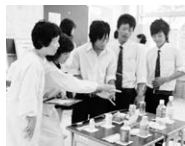
高校の文化祭で啓発活動