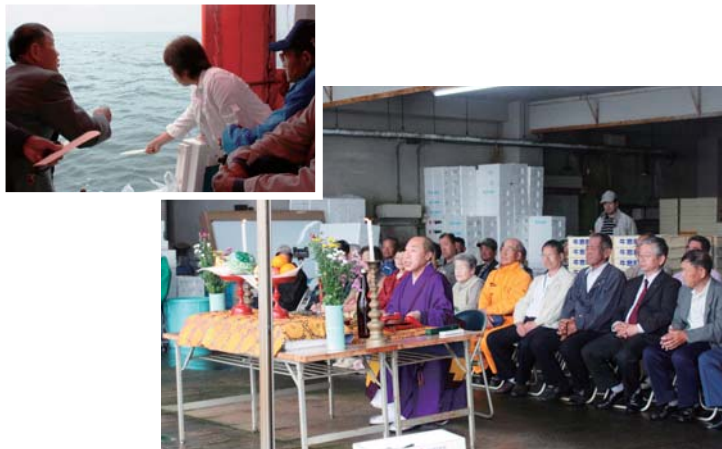
船上から冥福を祈る遺族ら（左上）／漁業者や遺族などが安全と豊漁を祈願（右下）

5月28日、牛窓町漁業協同組合（牛窓町牛窓）で海上慰霊祭と魚供養が行われ、関係者およそ50人が参列しました。