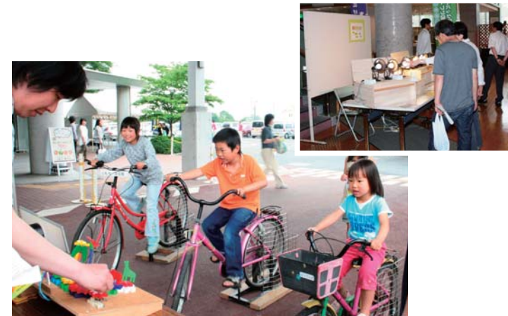
自転車をこいで発電を体験する子どもたち（左下）／種類によって明るさが違う電球（右上）

6月5日、ゆめトピア長船で環境フェスティンせとうちを開催しました。多くの親子連れらが訪れ、省エネルギーやごみの減量を取り入れた生活習慣について、楽しく学んでいました。