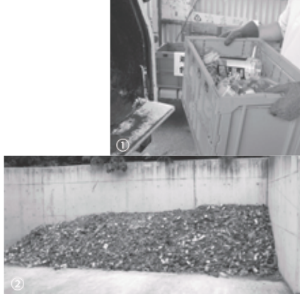
①ごみステーションで色別にコンテナで回収されるビン／②回収された雑色ビンの山

雑色の3種類に分類して回収しています。無色と茶色のビンは、それぞれ細かく砕かれ、再びビンの原料として使用されます。ビンに使用されているガラス素材は、品質が劣化しにくいため、くり返し利用できる特長があります。