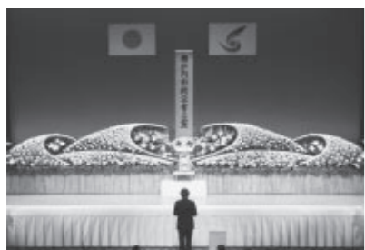
平成23年度戦没者追悼式

■通報受付・相談先 ①平日の午前8時30分～午後5時15分 瀬戸内市障害者虐待防止窓口