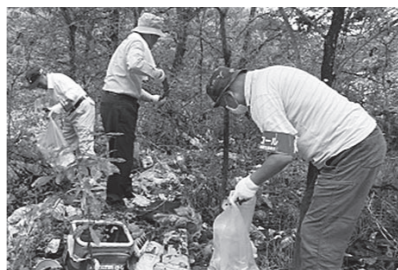
瀬戸内市環境衛生協議会や環境美化推進巡視員による定期的なパトロールが実施されています

不法投棄は犯罪です。刑罰も「5年以下の懲役もしくは、1千万円以下の罰金またはその併科」と定められています。投棄現場を目撃したときは、瀬戸内警察署か生活環境課へ通報してください。