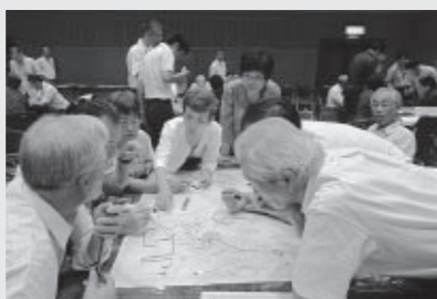
災害図上訓練DIGによるワークショップ