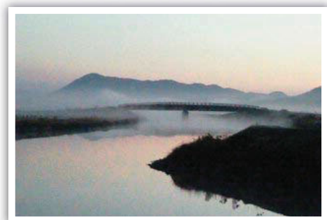
題名 霧の中に浮かぶ橋 撮影場所 邑久町豊原 撮影日時 平成23年12月5日(月) 午前6時25分