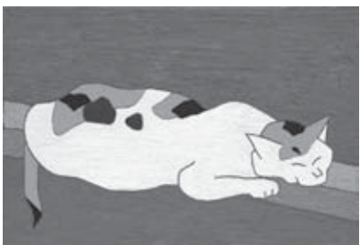
熊谷守一「猫」昭和40年愛知県美術館（木村定三コレクション）

されてこなかった作品を展示します。小さな画面から生まれた微かな「いのち」の輝きをどうぞご鑑賞ください。