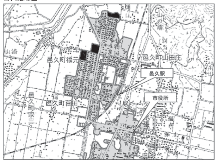
今回供用開始区域 既供用区域