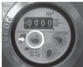
水道メーターのパイロット

道業務課で行うことができます。口座番号を確認できるものと通帳印を持参の上、手続きをしてください。