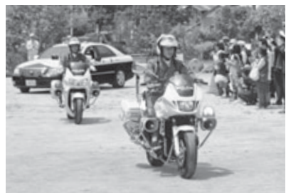
街頭啓発活動に出発します

4月6日(金)から15日(日)までの10日間にわたって、春の交通安全県民運動が県下一斉に展開されます。 市では、春の交通安全県民運動瀬戸内市出発式を開催し