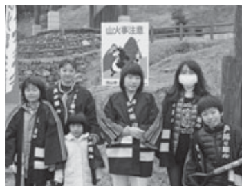
看板を設置し、注意を呼び掛け