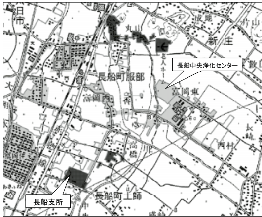
今回供用開始区域 既供用区域