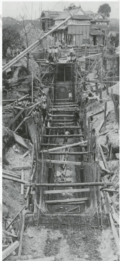
昭和10年ごろの大用水(豆田・四軒家で干田川と交差する地点)の改修工事

吉井川から取水し、現在の長船地域から邑久地域の福田地区や豊原地区を経て、岡山市東区神崎に至っています。ここまで13キロあまり。