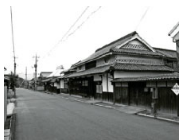
今に残る備前福岡の町並み