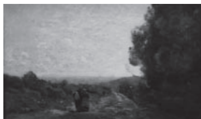
コロ「バリ遠望（セーブルより）」

20世紀西洋巨匠版画展では、ピカソの代表作「貧しき食事」など、象徴的な作家の版画作品を展示し、その原点