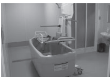
せとうち旭川荘のリフト付き浴槽

家庭での入浴が困難な重度の障害のある人は、障害者自立支援法に基づく生活介護などのサービスを利用して入浴