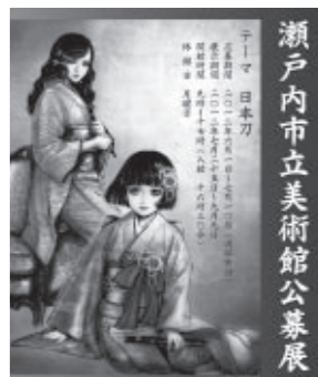
瀬戸内市立美術館公募展

▽応募方法 応募用紙に必要事項を記入し、作品(立体物は、撮影した写真)とともに送付してください。 応募要項・用紙は瀬戸内市立美術館、備前長船刀剣博物館