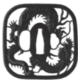
龍図透鐔 銘 越前住記内作

円、高・大学生300(250)円、中学生以下無料 ※( )は20人以上の団体料金です。 ▽図録販売 限定500部(2,000円、税込み) ■問い合わせ先 備前長船刀剣博物館 ☎0869・66・7767