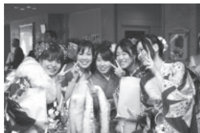
平成24年成人式にて