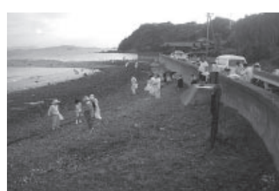
昨年の海岸清掃（前泊海岸）

「リフレッシュ瀬戸内（海岸清掃）」が実施されます。美しいまちづくりを推進するこの運動に、市も参加しています。 市民の皆さんのご参加とご協力をお願いします。 ▽実施日時 7月4日（水）午後5時30分～午後6時30分（小雨決行） ▽実施場所 ・邑久町福谷 前泊海岸 ・邑久町虫明 扇海岸 ▽集合場所 現地（いずれかの海岸）集合 ※ごみ袋・軍手は市で用意します。 ■問い合わせ先 建設課 ☎0869・22・2649