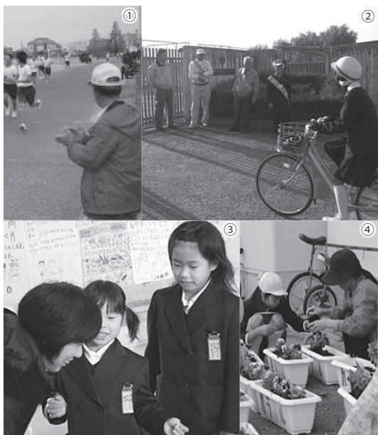
①マラソン見守り支援(邑久中)／②あいさつ運動(邑久中) ③学習支援(国府小)／④環境整備・花植え(国府小)

市では、未来を担う心豊かでたくましい子どもたちを育てるため、学校・家庭・地域が連携して地域ぐるみで学校運営を支援する体制づくり(学