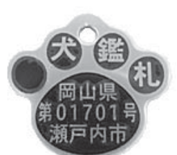
小型犬にも着けやすいよう小さく・軽くした鑑札

市や動物愛護センターが迷い犬を保護したときに、首輪などに鑑札や注射済票が着いている場合は、飼い主に速やかに連絡を取ることができます。飼い犬を失わないために、必ず着けましょう。