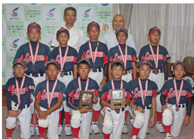
市長と教育長に第3位の報告をした際の記念の集合写真

邑久リーグス軟式野球スポーツ少年団は、8月10日から13日にかけて行われた第35回全日本都市対抗少年野球淡路島大会に、岡山県代表として出場し、奈良県、北海道、香川県、兵庫県のチームに競り勝ち、第3位となりました。この4日間で、選手は精神的にも技術的にも成長しました。子どもたちは大人に、大人も子どもたちに感謝する素晴らしい大会でした。活動に興味のある人は、お問い合わせください。