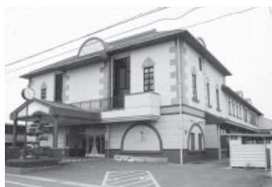
トータルサポートセンター準備室が設置されている瀬戸内市総合福祉センター

在宅医療連携拠点事業の実施により、市民病院、医師会、歯科医師会、介護事業所、福祉施設などが連携し、いつで