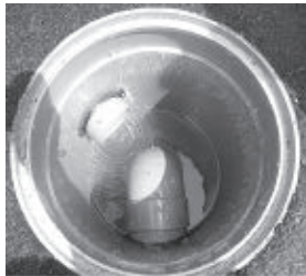
きれいな台所排水ます