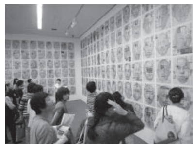
多くの人が訪れた「吉村芳生展」

5月31日から7月15日まで開催した「色鉛筆で描かれた超細密画 吉村芳生展」で、代表作「新聞と自画像」シリーズなどの展示やワークショップなどを行い、美術館の催事の中で歴代1位となる9,690人の来館を記録しました。