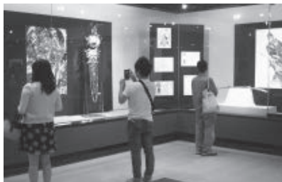
備前長船刀剣博物館で開催された「二次元V[S]日本刀展」

で、著名な漫画家やイラストレーター39人が参加し、日本刀などをモチーフにしたキャラクターやストーリーを創作し、絵と日本刀を合わせて展示しました。