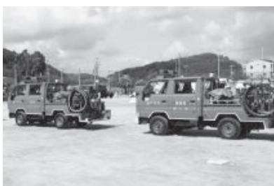
防災訓練に参加する瀬戸内市消防団の消防車