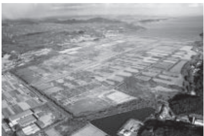
約500%の錦海塩田跡地

実証運行期間は平成25年12月末までとしていましたが、利用者も増えてきており、改善後の検証を慎重に行う必要があるため、実証運行期間を平成25年度末までに延長し、利用実態の分析と費用対効果の検証を行っていきたくて考えています。