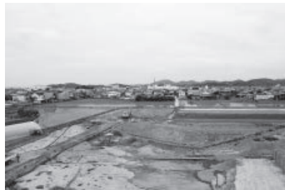
埋蔵文化財発掘調査が完了した新瀬戸内市市民病院予定地