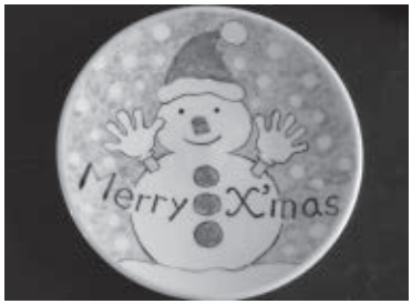
皿絵付けを楽しみませんか

▽期間 11月4日(月・祝)まで ※休館日は、毎週月曜日(祝日を除く)、祝日の翌日です。 ▽時間 午前9時～午後5時 ※受付は午後3時まで ※10人以上で参加する場合、