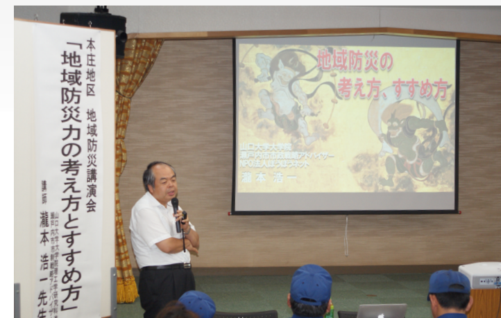
購入した機器を活用して防災の研修会を行った本庄地区コミュニティ協議会

(財)自治総合センターの宝くじ助成金を活用し、本庄地区コミュニティ協議会が椅子、机、プロジェクター、電子黒板、音響機器などを購入しました。