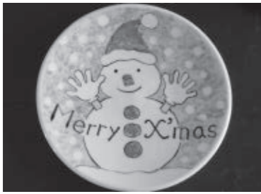
皿絵付けを楽しみませんか