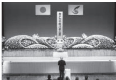
平成24年度戦没者追悼式