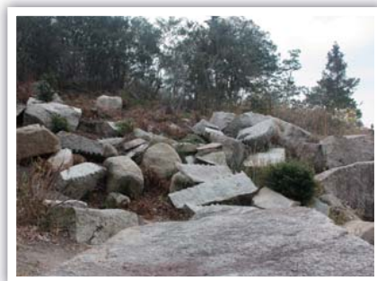
題名 ニコはどこでしょう 撮影場所 前島(牛窓町牛窓) 撮影日時 平成25年3月