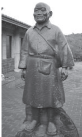
時實黙水氏の備前焼陶像(寒風陶芸会館)