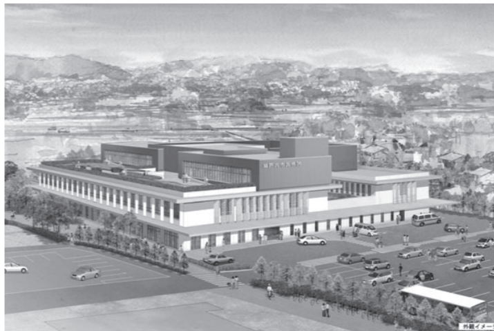
新瀬戸内市民病院外観イメージ