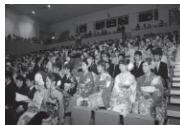
平成25年成人式にて

「成人式」を企画運営する新成人を募集しています。応募期限は8月30日(金)です。