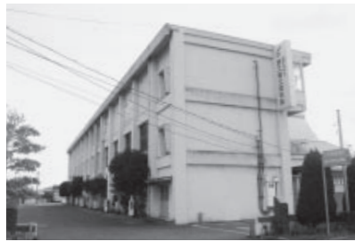
跡地を含めた用地に新図書館の建設が計画されている邑久郷土資料館