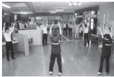
市役所本庁で行ったラジオ体操（チャレンジデー）

また、チャレンジデーをきっかけとして、各地域や職場・学校などにおいて、運動習慣が身につく、スポーツを通じて健やかに暮らせるまちを目指して、取り組みを進めているところです。