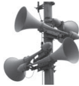
防災行政無線スピーカー

生じた淡路島付近を震源とした、マグニチュード6.3、震度6弱の地震で、瀬戸内市においては最大震度4を観測しました。