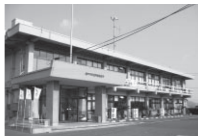
昭和38年に建てられた長船支所の庁舎

昭和の大合併以後、高度成長期からバブル期に建設された施設の更新需要が迫る中、毎年耐震化を含め、施設の維持補修に係る経費が財政上も大きな負担となっており、今後は厳しい財政をさらに圧迫