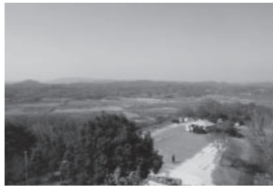
オリーブ園から望む錦海塩田跡地

産業廃棄物最終処分場の適正廃止に向けた覆土については、国土交通省中国地方整備局岡山河川事務所からまとまった規模の搬入が始まりました。順調にいけば、本年度上半期で覆土を完了できる見込みです。