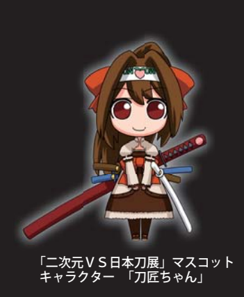
「二次元VS日本刀展」マスコットキャラクター「刀匠ちゃん」

負をテーマとして、現代のコンテンツアーティストが同館が所蔵する国宝、重要文化財などの刀剣や甲冑などの伝来をモチーフに制作した新しい漫画やイラストを館藏品と共に展示します。 また平家物語絵巻や洛中洛外図屏風、能面などの収藏品とのコラボレーション作品も制作し、そのモチーフとなった収藏品と共に展示します。主な関連イベントについては、お問い合わせください