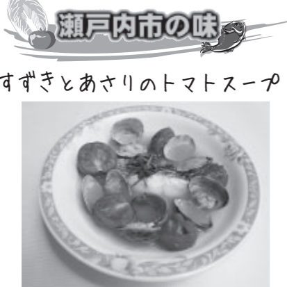
瀬戸内市の味 すずきとあさりのトマトスープ