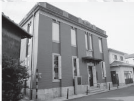
街角ミユゼ牛窓文化館外観

この建物は、大正4(1915)年に牛窓銀行本店として建設されたものです。設計者は山村精一。施工者は森田吉です。鉄筋コンクリート造りですが、屋根は寄せ棟瓦葺きの和風となっています。外から見ると二階建て