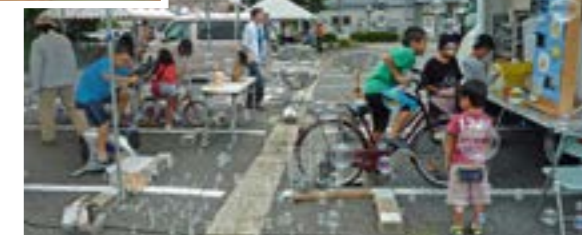
生ごみ処理機の展示(左上) / 自転車型発電機を使った発電(右上)