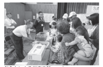
気象台による災害実験コーナー

牛窓北小学校を会場に、「災害・防災」をテーマにした三世代交流イベント「うしまど地域交流フェア」を開催し、約250名が参加しました。