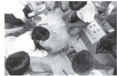
DIGで通学路上の危険箇所などを確認

防災学習を授業で取り入れたのは、市内では本小学校が初めてであり、児童たちは、通学路上の危険な場所を地図や現地を確認し、通学路グループごとの「避難マップ」を完成させました。この「避難マップ」は、学校内に掲示され、学校全体の防災対策に役立てられています。