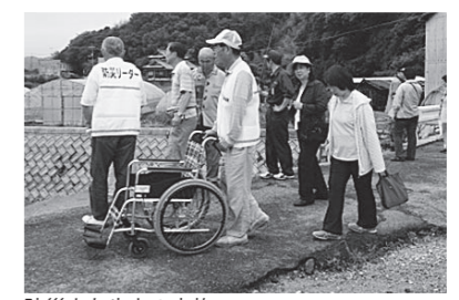
防災まち歩きの実施

研修会は、コミュニティ協議会と共催で、「災害図上訓練DIG」や現地を歩いて実際に避難する際の危険な場所や安全な場所など確認する「防災まち歩き」「防災マップづくり」を行いました。