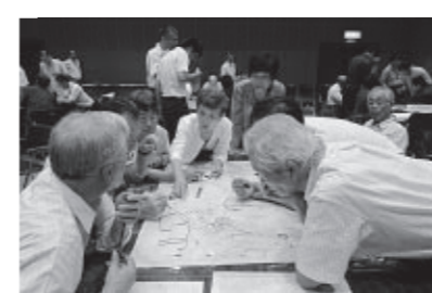
災害図上訓練DIGの実施

沿岸部がある牛窓町牛窓地区も、南海トラフ巨大地震による津波被害が広域的に予想されるほか、平成16年の台風での高潮で、甚大な被害を受けた地域です。