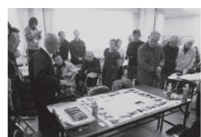
防災マップの作成

研修会では「災害図上訓練DIG」や現地を歩いて実際に避難する際の、危険な場所や安全な場所など確認する「防災まち歩き」「防災マップづくり」を行いました。