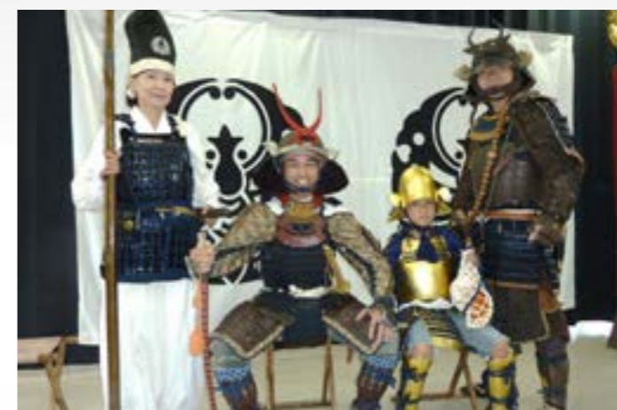
甲冑を身につけ武器・武具を手に、記念の写真撮影

備前長船刀剣博物館では、7月13日から9月16日まで、「二次元VS日本刀展」を開催しています。会場には、この特別展に合わせて作り上げた日本刀と、その日本刀をモチーフにコンテンツアーティスト(作家、イラストレーター、漫画家、造型家)がオリジナルデザインの日本刀を新しい作品に登場させ、その作品を同時に展示しています。