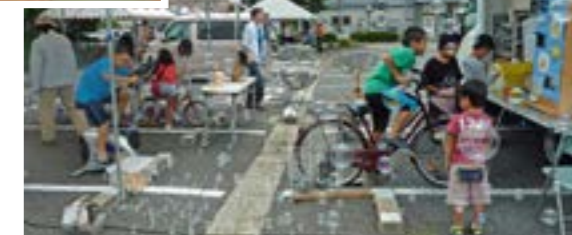
生ごみ処理機の展示(左上) / 自転車型発電機を使った発電(右上)