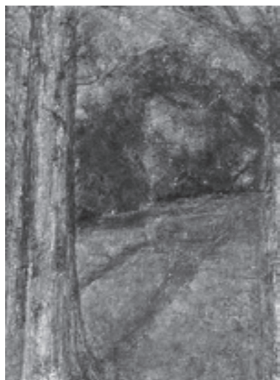
△佐竹徳「オリーブ園」1985~1986年頃

一枚一枚 キャンバス に向かう季節や時間帯を決めていたり、制作の途中で枯れてしまつた樹を絵から消したりしてしまつた。作品に残された痕跡や複数の作品を見比べることで、