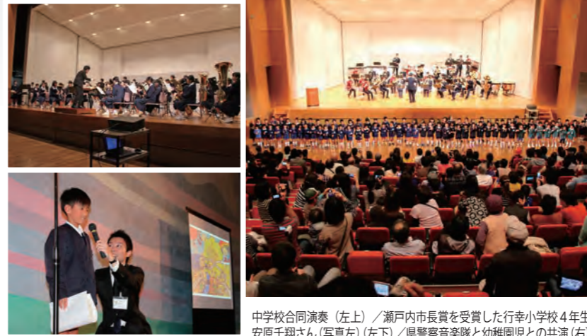
中学校合同演奏(左上) / 瀬戸内市長賞を受賞した行幸小学校4年生安原千翔さん(写真左)(左下) / 県警察音楽隊と幼稚園児との共演(右)

11月1日、ゆめトピア長船で、瀬戸内市誕生10周年記念事業を行いました。(本紙表紙と本紙折り込みの記念誌を参照)午後の記念行事では、市内3中学校吹奏楽部による演奏や市内の各小学校4年生児童が「僕たち私たちの瀬戸内市未来予想図」と題して10年後の市の姿を描いた絵画の入賞作品の表彰、岡山県警察音楽隊と市内各幼稚園児との共演を行いました。館内では絵画の展示も行われ、来場者は夢と希望にあふれた作品に見入っていました。