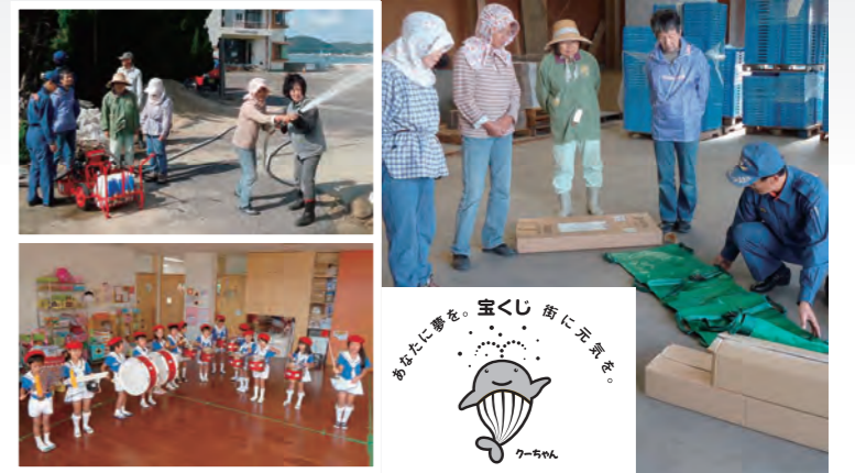
消防ポンプを使用して放水訓練(左上) / 鼓笛隊セットで演奏する園児たち(左下) / 応急手当セットの取扱訓練(右)

軽可搬消防ポンプ一式と応急手当セットは、地域住民の防火防災意識の高揚や火災発生時の初期消火活動などに役立ててもらうため、10月14日に前島婦人防火クラブに寄贈しました。鼓笛隊セットは、クラブの育成強化や防火思想の普及啓発を図るとともに、鼓笛演奏を通じて市民に火災予防を呼びかけてもらうため、10月15日に長船ちとせ保育園幼年消防クラブに寄贈しました。