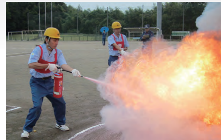
消火器を使って消火技術を競う

10月23日、長船スポーツ公園で、第4回瀬戸内市消火技術訓練大会を開催しました。