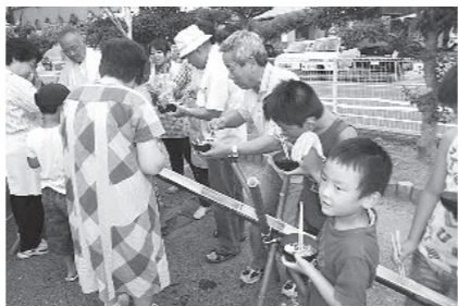
ふれあいそうめん流し大会