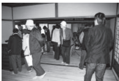
再生された古民家

また、長船町福岡にある古民家の再生・活用を目指して、地元との連合町内会、史跡保存会などと協力して事業を推進しています。築約100年の