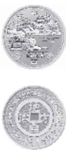
図柄(表面:岡山後楽園、裏面:古銭のイメージ)