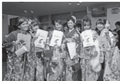
平成25年瀬戸内市成人式会場にて