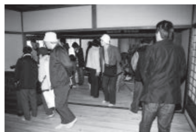
再生された古民家

観光庁の官民協働した魅力ある観光地の再建・強化事業に、市が提案した「おさふね日本刀のルーツと備前福岡歴史のたび」が採択され、現在取り組みを進めています。