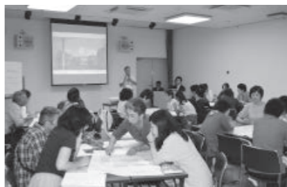
第8回としよかん未来ミーティング

プロポーザルによる設計者選定後、教育委員会と設計者による基本設計案の検討を進めてきました。