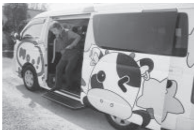
モーモーバス降車の様子

平成24年7月から実証運行を実施している瀬戸内市デマンドバス「モーモーバス」は、10月末現在、利用登録者数1,425人、そのうち利用者が563人、利用割合は39.5%です。利用者数(実員)6,250人、1日平均12.8人、予約件数(運行回数)は12,199回、1日平均25