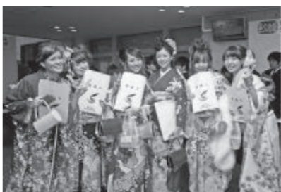
平成25年瀬戸内市成人式会場にて