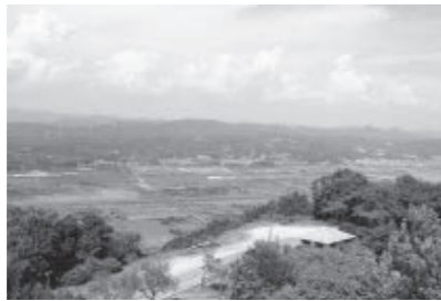
オリーブ園から望む錦海塩田跡地

県の開発行為許可申請については、10月31日に提出されました。この許可申請については、3カ月以内に決定されるよう定められています。1日でも早く許可が得られるよう市も県へ働きかけをしています。