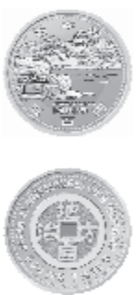
図柄(表面:岡山後楽園、裏面:古銭のイメージ)