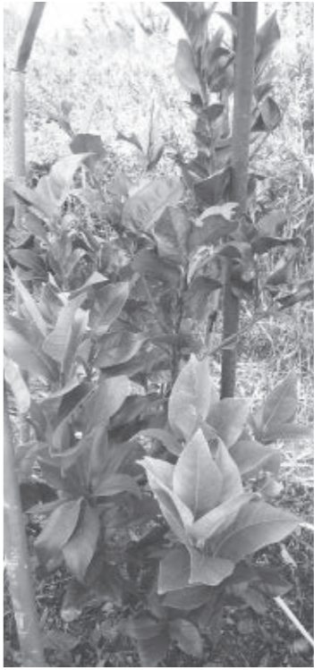
成長した苗木 (昨年配布したもの)

瀬戸内市発ブランドは、瀬戸内市の「美しさ」をブランドコンセプトとし、「Setouchi Kirei(セトウチキレイ)」と表現しています。市では、このブランドを市内の農水産業・加工・販売などの関係者や消費者、地域の皆さんとともに育み、発信することを目指しています。このたび、ブランドの先導作物であるレモンを市民の皆さんに身近に感じてもらうために、苗木を無料で配布します。