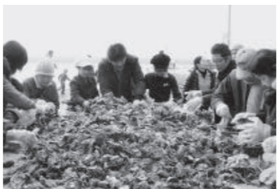
人気の殻付きカキ詰め放題

▽日時 2月8日(土) 午前9時30分～(売り切れ次第終了) ▽場所 牛窓町漁業協同組合(牛窓町牛窓3909-1) ▽内容 新鮮な地魚、カキの販売