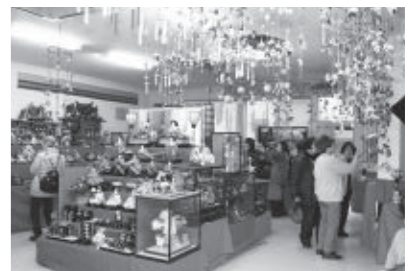
平成25年のおひなさまフェスタ

瀬戸内市消費生活問題研究協議会邑久グループでは、おひなさまフェスタを開催します。古布でおひなさまを作る体験コーナー、さくら茶やコーヒーを楽しむコーナーもあります。リサイクルを考えながら、桃の節句を一緒に楽しみませんか。 ▽日時 2月23日(日) 午前9時~午後3時 ▽参加費 無料(一部有料)