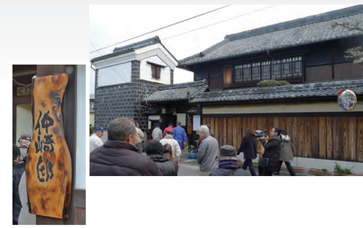
玄関に取り付けられた看板(左下) / 再生された築約100年の古民家「仲崎邸」(右上)