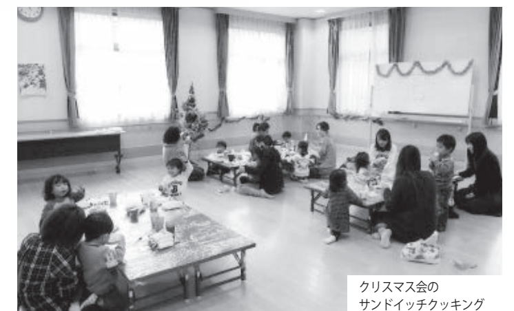
クリスマス会のサンドイッチクッキング

会員から一言 少人数で和気あいあいと楽しく活動しています。ぜひ一緒に親子で親睦を図りましょう。