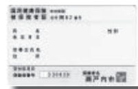
国民健康保険被保険者証