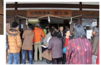
火花が散った刀匠らによる古式鍛錬(左上) / 大勢の市民や観光客が訪れました(右下)