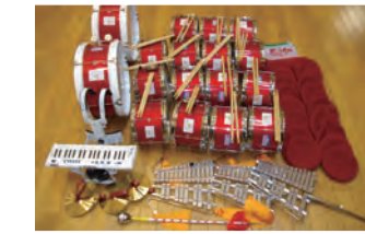
購入した鼓笛隊セット(左下) / 支給されたセットを使った鼓笛の練習(右上)