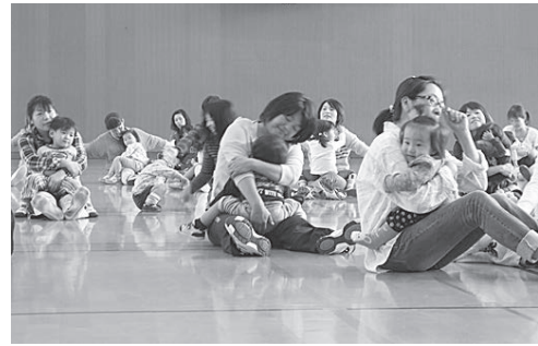
4クラブ合同の交流会