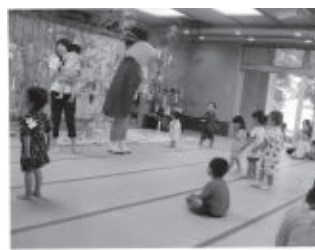
七夕祭り（左）／秋の遠足（右）

会員から一言 友達と楽しい思い出をいっぱい作りましょう。入会をお待ちしています。