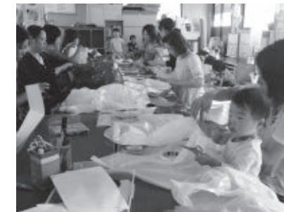
ハロウィン制作（左）／クリスマス会（右）