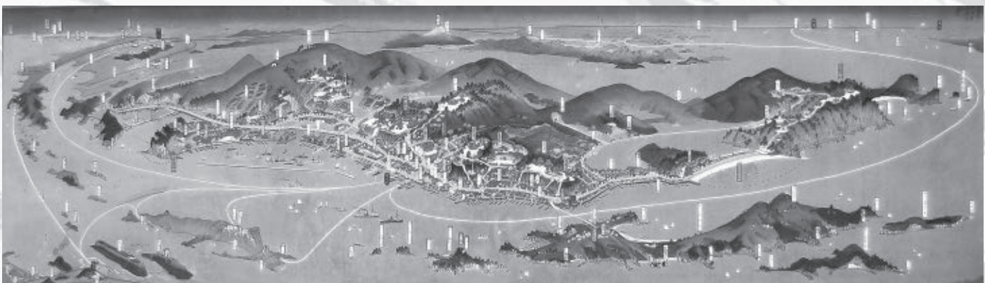
△景勝之牛窓町鳥瞰図

【参考文献】『牛窓町史通史編』『絵図と風景』(神戸市立博物館)『パノラマ地図と旅』(福山市鞆の浦歴史民俗資料館)