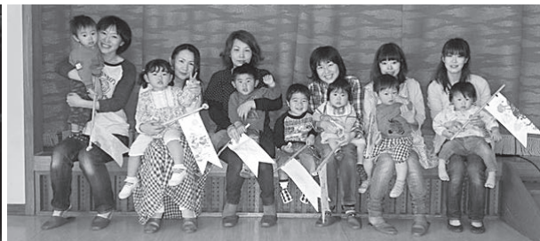
こいのぼり製作（右）／消防署見学（左）