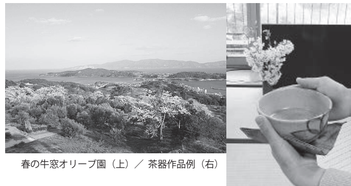
春の牛窓オリーブ園(上) / 茶器作品例(右)