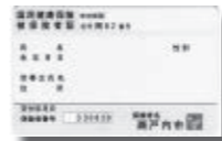
国民健康保険被保険者証