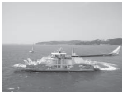
平成25年5月に就航した新造船「まえじま丸」

約7分の航路。フェリーの船上や前島の展望台などから瀬戸内の多島美を楽しめます。また、前島は釣りやキャンプに絶好の場所。これを機に、家族で訪れてみませんか。