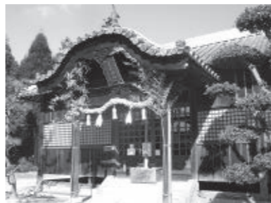
陶工たちが信仰した美和神社