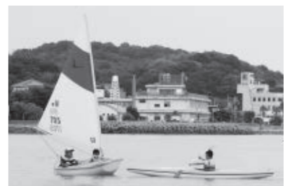
アクセスディンギーとカヌー

は、舵杯ヨットレースの開催に合わせて、アクセスディンギー(ヨットの一種)・カヌーの試乗会を行います。