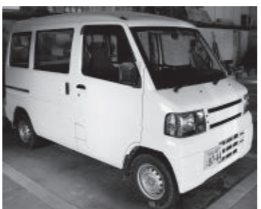
対象になる場合は申請をお忘れなく

身体に障害のある人や重度の精神障害のある人が所有している軽自動車は、申請によって、1人1台に限り軽自