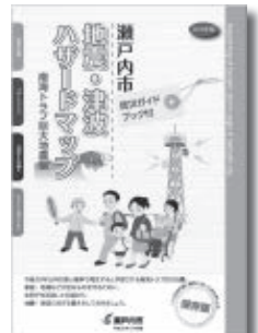
地震・津波ハザードマップ