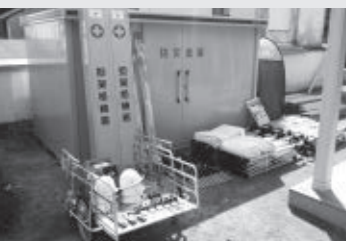
関町自主防災会が整備した防災資機材

関町2014 舵杯実行委員会 事務局 芝さん ☎080・4268・9485 〒701・4302 瀬戸内市牛窓町牛窓3900