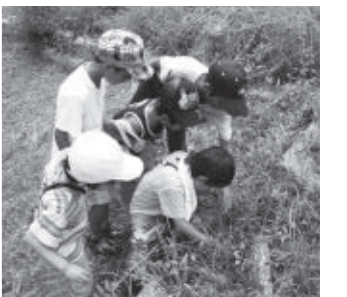
野山に入る場合は注意しましょう

・地面や草むらに、じかに寝転んだり、腰を下ろしたり、服を置いたりしない。 【野外で活動した後は】 ・すぐに入浴し、体や頭をよく洗い、新しい服に着替える。 ・脱いだ衣類はすぐに洗濯するか、ナイロン袋に入れて口を縛る。