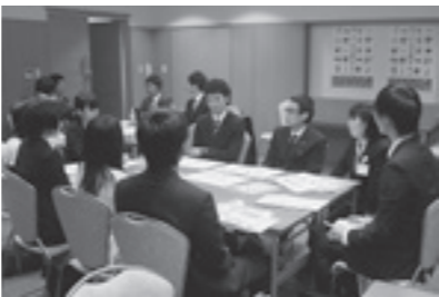
説明会での若手職員との対話(平成25年実施)

赤十字社員とは、日本赤十字社が行う国際救援や災害救護などの人道的な理念や活動に賛同し、年額500円以上の社費を納めた人のこと、個人・法人を問わず、誰でもなることができます。