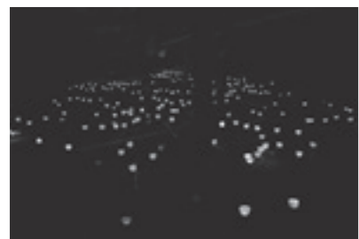
『発光』(2013年/針金・和紙・石膏・蜜蝋・LED電球/サイズ可変)

マドリッドに移住し、以後スペインと日本の文化交流を目的の一つとして作家活動を行っています。今回は、花の変容を光や音