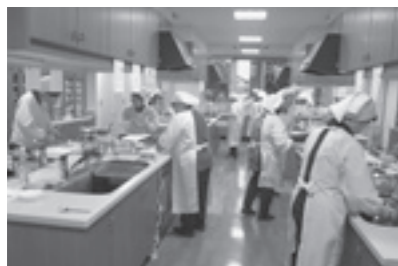
栄養バランスを考えて調理実習