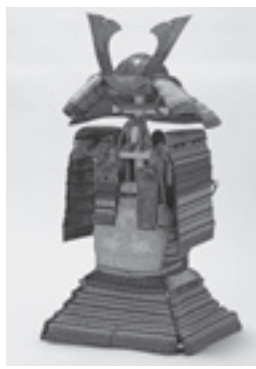
色々威甲冑(保存修理後)

豊原北島神社(邑久町北島)の宝物で、国の重要文化財に指定されている「色々威甲冑」が、平成25年度に保存修理されました。修理の完了を記念して、岡山県立博物館で特別陳列されています。