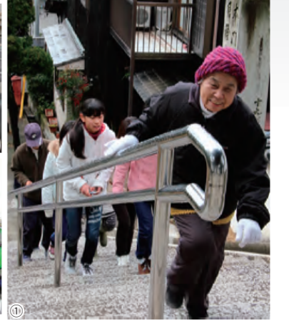
①高台への避難 / ②消防団員に誘導され移動する住民 / ③災害対策本部での情報収集