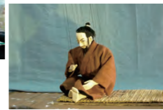
繊細な人形の動きを表現する操作者の手元にも注目（左上） / 幽閉中の官兵衛（右下）