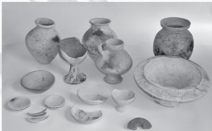
今回の発掘調査で出土した土器・石器の一部

今回の調査で明らかになった遺構などから隣接する邑久町尾張地内の馬場崎遺跡（邑久高校を中心にした辺り）や堂免遺跡（市役所を中心にした辺り）を中心とした集落の広がりや関係性を考える上で貴重な資料がいくつか確認できました。