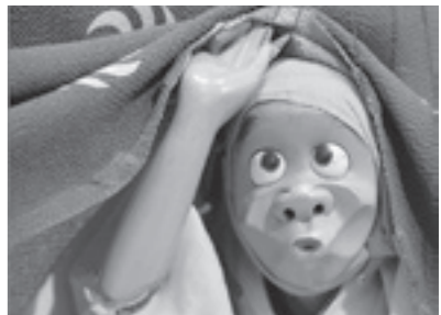
喜之助人形「獅子舞」