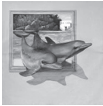
△安藤哲男「イルカ」2011年