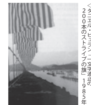
「タニエル・ヒュラン」文字波止の200本のストライプの旗」1985年

美和歩く会では、ヘルスアップウォーキングを開催します。今回は、美和神社から朝日寺・道の駅「一本松展望園」までの尻海古道を往復します。 美和神社から昔の道を、サザラシ古墳・山桜の巨木群にも寄り道しながら朝日寺まで下ります。竹久夢二の母の生家跡にある榎も見た後、道の駅「一本松展望園」まで歩くコースです。申し込み不要です。ぜひご参加ください。 ▽日時 10月5日(日) 午前9時～午後3時(午前8時50分集合) ※雨天の場合は10月12日(日)に延期します。不明な場合は、お問い合わせください。 ▽集合場所 美和神社駐車場 ▽参加費 200円(保険代など) ▽持ち物 弁当、飲み物、雨具 ▽美和歩く会 妹尾さん ☎090・7243・6752