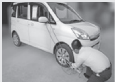
△滞り納付(自動車差押え)の様子

市税(料)の納付は、納期限内の自主納付が原則です。納期限を過ぎた場合は、 【納期限内納付に協力ください】 市税(料)の納付は、納期限内の自主納付が原則です。納期限を過ぎた場合は、 そのため、納期限を過ぎた後、納付のない人に対しては、やむを得ず滞納処分により財産を差し押さえることで強制的に徴収を行っています。