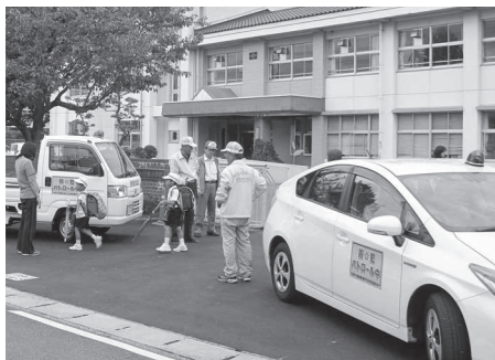
地域の皆さんによる防犯パトロール活動

「全国地域安全運動」は、10月11日から20日までの間、全国一斉に展開されます。 岡山県では、「安全・安心まちづくり旬間」とともに実施され、地域安全活動に携わる人たちが、その活動をより一層浸透・定着させるため、広報啓発活動やパトロール活動を強化します。 また、子どもや女性を対象にした犯罪や不審者対策の推進、高齢者が被害となりやすい特殊詐欺の被害防止などを柱として、地域一丸となった地域安全活動を推進していきます。