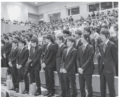
平成27年瀬戸内市成人式会場にて

市では、平成28年瀬戸内市成人式を次のとおり開催します。新成人の皆さんの参加をお待ちしています。