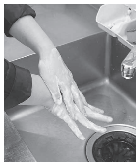
手の甲まで丁寧に洗いましょ

予防のポイントは、次のとおりです。 【清潔(ウイルスをつけない)】 ・調理前や用後は、せっけんを用いて十分な流水で手をよく洗いましょ。 ・下痢やおう吐などの症状がある場合は、食品を直接取り扱う作業をしないようにしましょ。 ・二枚貝などを取り扱うときは専用の調理器具(まな板、包丁など)を使用するか、取り扱った後は、調理器具を十分に洗浄消毒しましょ。