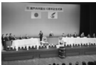
瀬戸内市誕生10周年記念式典

将来に向けた投資となる積極的な取り組みを進めるため、国が進めている「まち・ひと・しごと創生総合戦略」による新たな交付金事業に対応できるよう、市長特別枠として「100年先へ人の輪がつながるまち」をテーマに瀬戸内市としての地域活性化、人口減少対策のための新たな事業に取り組んでいきたいと