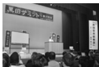
平成24年に瀬戸内市で行われた黒田サミット