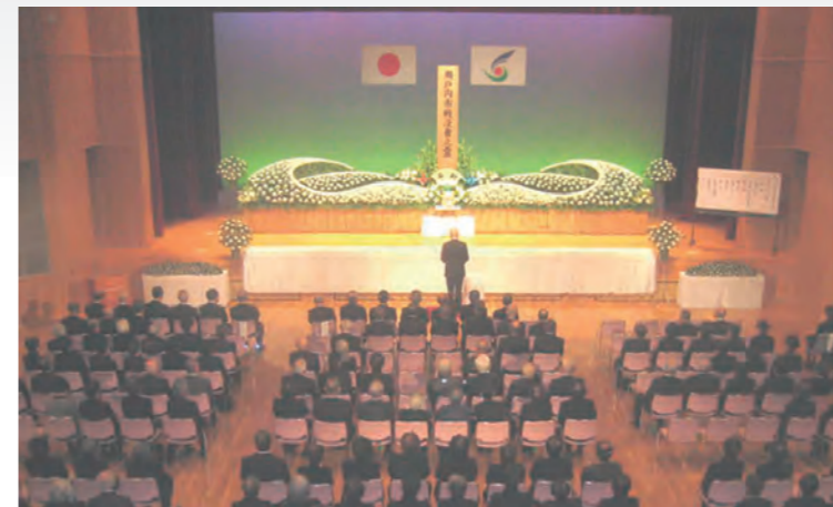
式辞を述べる武久顕也市長(写真中央)