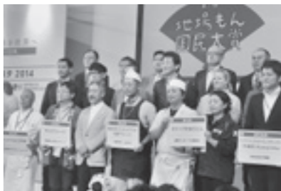
地場もん国民大賞表彰式

11月1日に、東京都千代田区丸の内で開催されたジャパンプードフェスタ「地場もん国民大賞」において、全国から応募された880品目の中から、市の進めている瀬戸内市発ブランド「Setouchi Kirei(セトウチキレイ)」の認定商品「牡蠣のアヒージョ」