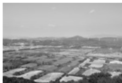
牛窓オーリーブ園から望む錦海塩田跡地