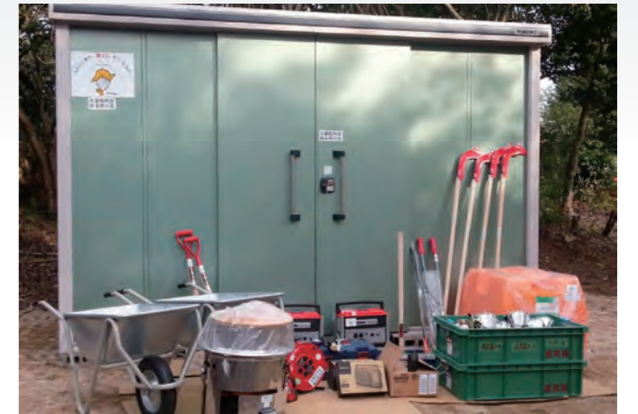
大富町内会自主防災会が整備した防災資機材