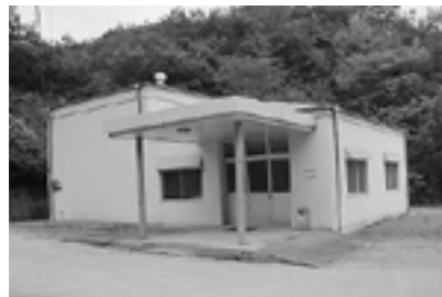
老朽化が進む瀬戸内市営火葬場

ナンバー制度への取り組みなど、社会情勢や新たな住民ニーズに対応するための経費が増加するため、今後公共施設の再編や民間委託の推進、受益者負担の見直しなど積極的に財政健全化の取り組みを進めていく必要があります。