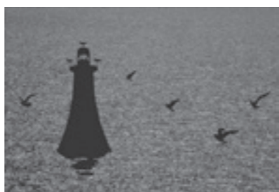
△緑川洋一「灯台に戯れる」1964年

「色彩の魔術師」として知られる写真家・緑川洋一(1915-2001年)は岡山県邑久郡裳掛村(現・瀬戸内市邑久町)に生まれ、2015年に生誕100年を迎えます。瀬戸内市立美術館では、今後、数年ごとにテーマを設けて、瀬戸内市ゆかりの作家・緑川洋一の展覧会を開催する予定です。