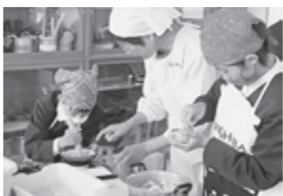
△小学校の調理実習で郷土料理を紹介

岡山県の栄養委員活動は、食糧が十分でなく栄養不足のため乳児死亡率が高かった昭和20～30年代にかけて、子どもたちの命を守りたいという願いから始まり、50年以上も長きにわたって引き継がれています。