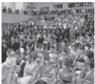
△平成26年瀬戸内市成人式会場にて

30分、式典・記念行事：午前10時30分～午後1時30分 ▽場所 ゆめトピア長船 ▽社会教育課 0869・34・5601