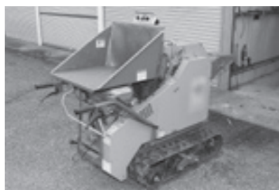
クリーンセンターかもめの樹木粉碎機

（可燃）の日に各集積所で回収することで、さらなるリサイクル化、さらなるごみの減量化を図っていきます。