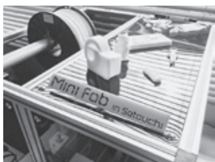
3Dプリンタを活用したものづくり事例