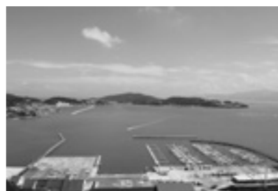
美しい眺めの瀬戸内海

晴れの国おかやま Destination Campaign は、R6社と地方自治体、観光事業者などがタイアップして平成28年春（4～6月）に行う大型観光キャンペーンであり、岡山県では、平成19年以