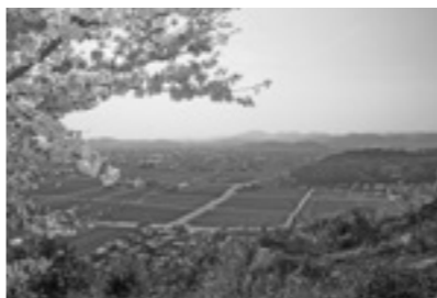
高砂山（邑久町山手）から望む千町平野

そのためには、私たちの心の中に、瀬戸内市のことをよく知り、ふるさとを大切だと思ふこと、地域を愛する気持ちをさらに育むことが必要だと考えます。