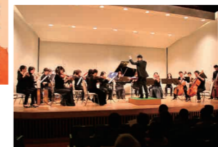
一つ一つ音を出しながらの楽器紹介（左上）／見事に調和した演奏（右下）

2月15日、中央公民館（邑久町尾張）で、瀬戸内市誕生10周年を記念して、岡山フィルハーモニック管弦楽団による演奏会が行われました。オープニングでは瀬戸内市のイメージソング「ふらり 瀬戸内 いいいきもち」を演奏。その後、竹久夢二作詞の「ふるさと」「風の子供」「宵待草」なども披露されました。