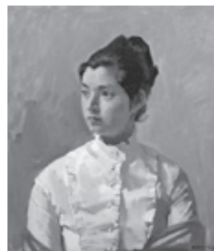
△小磯良平美術館所蔵「婦人像」1969年 油彩・キャンバス