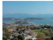
△牛窓オーリーブ園から