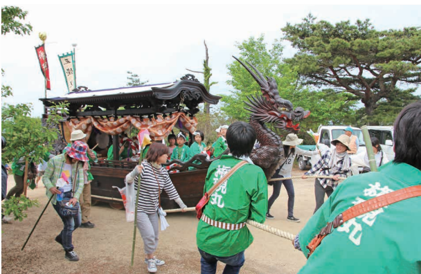
後、子どもたちを乗せた各地区のだんじりが、地域の人たちに引かれ、境内からお旅所へ練り歩きました。(写真 だんじりの上で威勢よく掛け声を上げる子どもたち (上) / 地域の人たちに引かれ、練り歩く豊安だんじり (下))