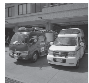
同時に出勤する場合があります

消防本部では、心肺機能が停止した傷病者に対し、多くの救急資器材を必要とする高度な救命処置を行う場合や、階段、通路が狭いため傷病者の搬送が難しい場合など、救急隊員のみでは対応が困難な事態に備え、要請の内容から必要を認める場合には、消防車と救急車が同時に出勤し、救急活動を行っています。