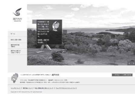
瀬戸内市ホームページ（総合トップページ）

① デザインを一新 総合トップページに写真を大きく取り上げ、説明やリンク先を表示させることで、市