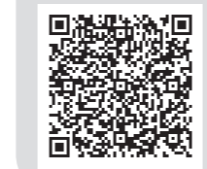
瀬戸内市メールマガジンHP 携帯電話用QRコード

瀬戸内市メールマガジンをご利用ください 市からのお知らせや催し物、災害情報などを瀬戸内市メールマガジンで配信しています。災害時には、避難情報のほか、道路の通行止め情報などを配信していますので、ぜひご利用ください。 以下のアドレスから登録できますので、ぜひ一度アクセスしてみてください。QRコード（二次元コード）の読み取りが可能な携帯電話の人は、以下の画像からもアクセスすることができます。 なお、市ホームページには、配信済みの瀬戸内市メールマガジンも掲載しています。 瀬戸内市メールマガジンホームページ HP http://www.city.setouchi.lg.jp/i/magazine.html