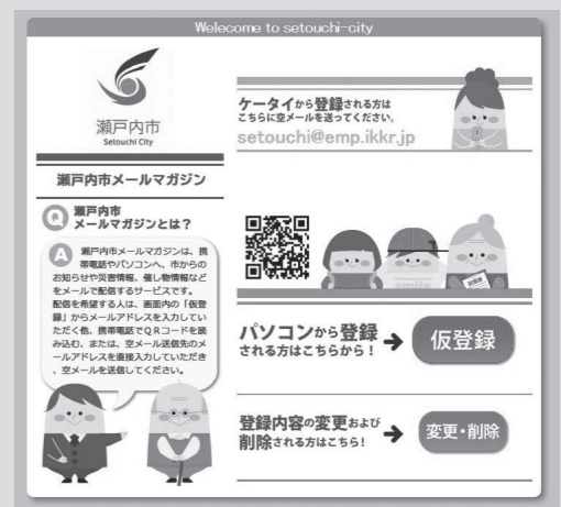
瀬戸内市メールマガジン登録画面